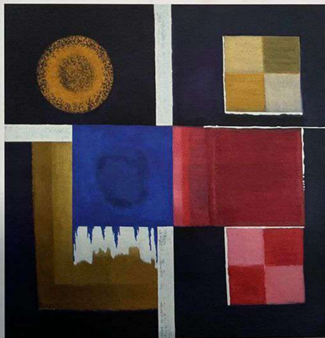
Carré - bleu cobalt, Huile sur toile 100 x 100 cm