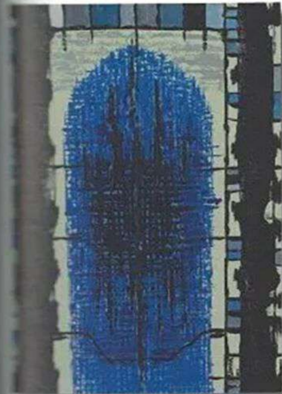
Structure tectonique en bleu, Acrylique sur carton toilé, 27 x 41 cm

As one of the leading masters of the so-called «tectonic» abstraction, Édouard Drumm was willing to answer our questions on this exciting cultural and artistic movement. Encounter.