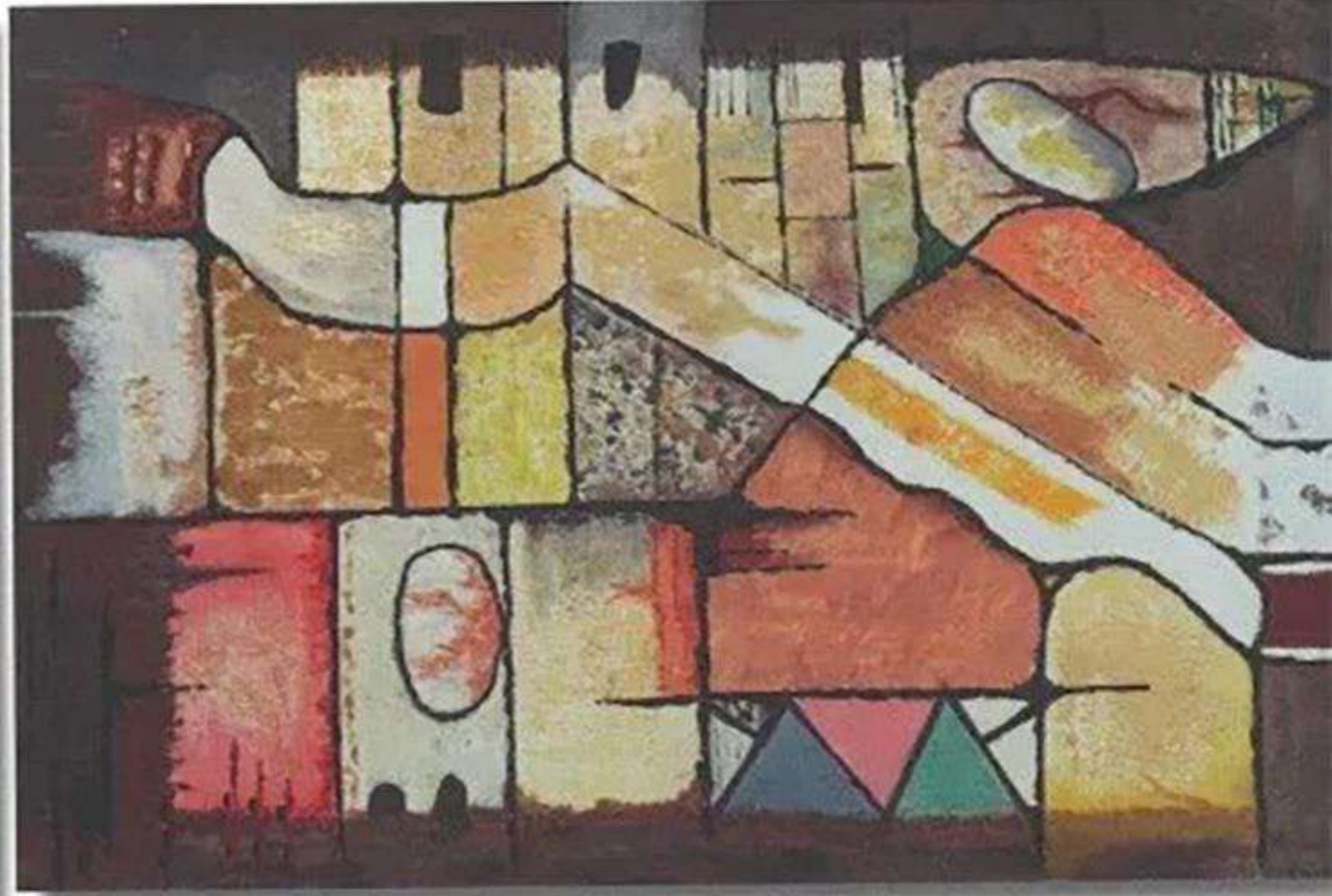
Grès - Structure tectonique, Acrylique sur toile, 70 x 50 cm