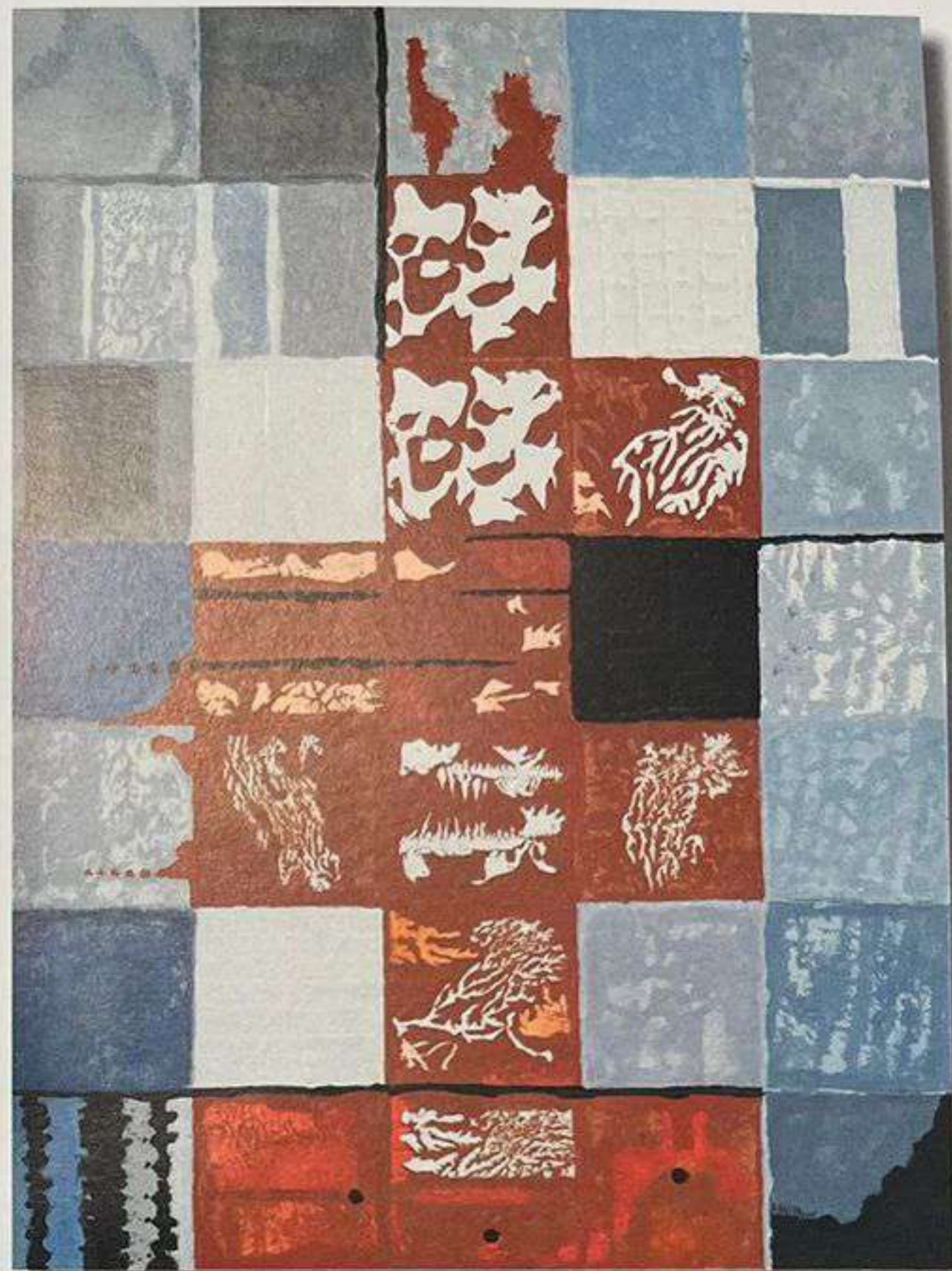
Triple accord, Acrylique sur toile, 50 x 70 cm

This geometry of the line coupled with the absolute freedom of the artist transforms abstraction into a genuine gem of contemporary art!