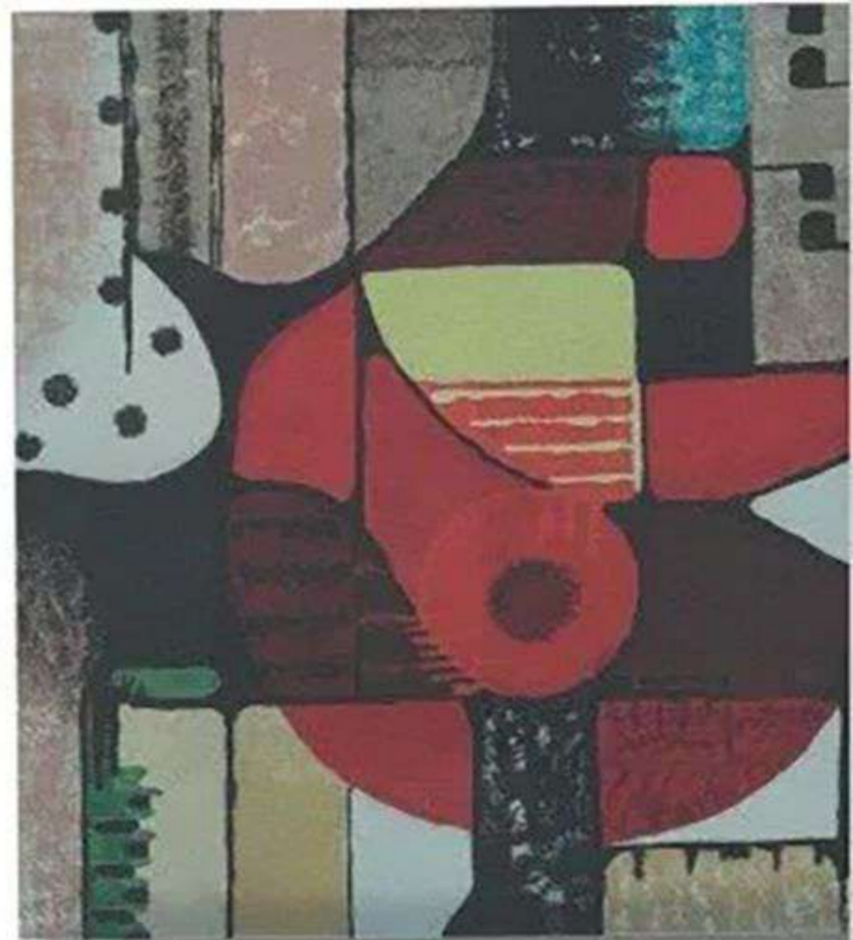
Rose en garance, Acrylique sur toile, 60 x 60 cm