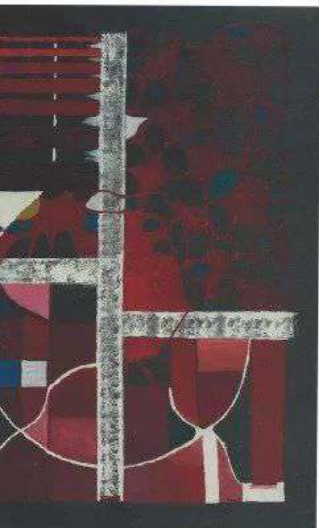
Formes amorphes et structure en germination. Huile sur toile, 70 x 100 cm